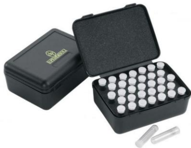
Exemple de charges préparées

Vous devez impérativement avoir préparé les doses de poudre avant d'accéder au pas de tir au risque de présenter une table de tir bourrée d'explosif !